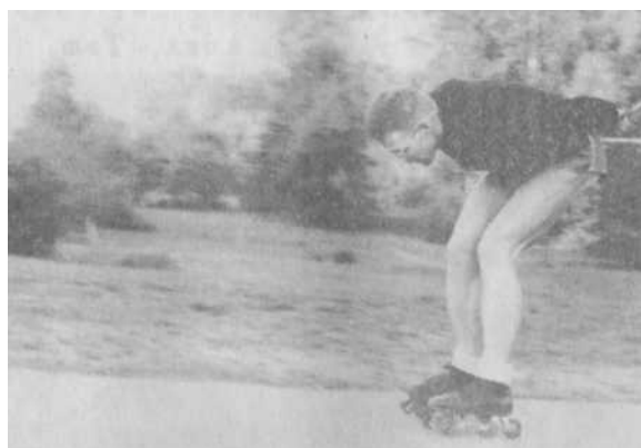
Осень 65-го. Через год все было так же