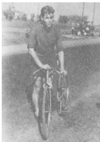
Чемпион Балашихинского района