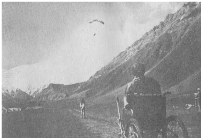
В воздухе - Леонид Мартынов. На фоне пика Ленина