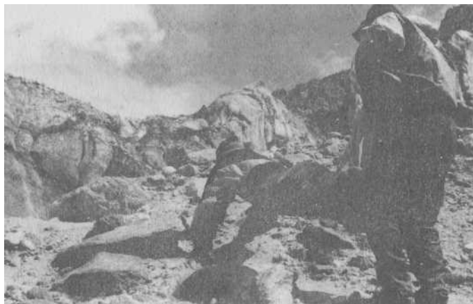
Дорога к месту тренировки. Поляна Москвина