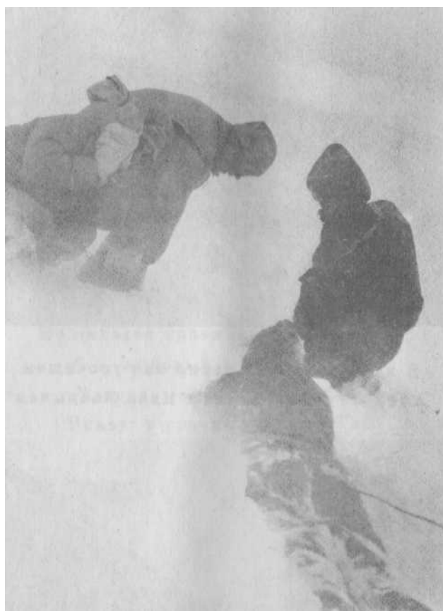
Эльбрус. Апрель 1991 года. Так продвигались вверх. Приходилось топтать колею в достаточно глубоком снегу