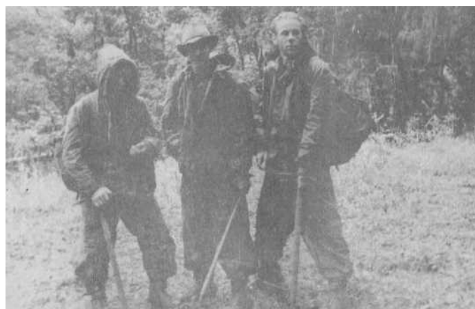
1951 г. Алибек. В шляпе