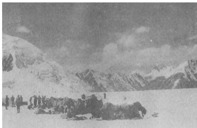
Лагерь под перевалом Чон-Терен