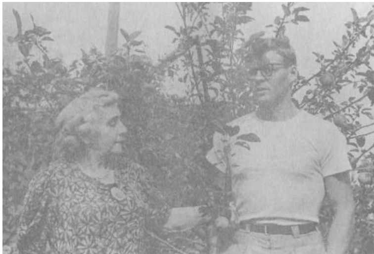
С мамой в Узком