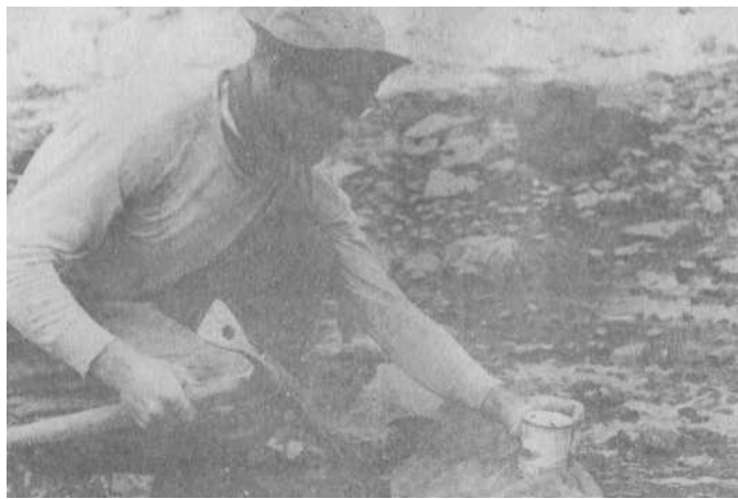
Но никакой травмой не перешибить любовь к сгущенке. Вверху: на склонах Победы. Внизу: в урочище Ачик-Таш