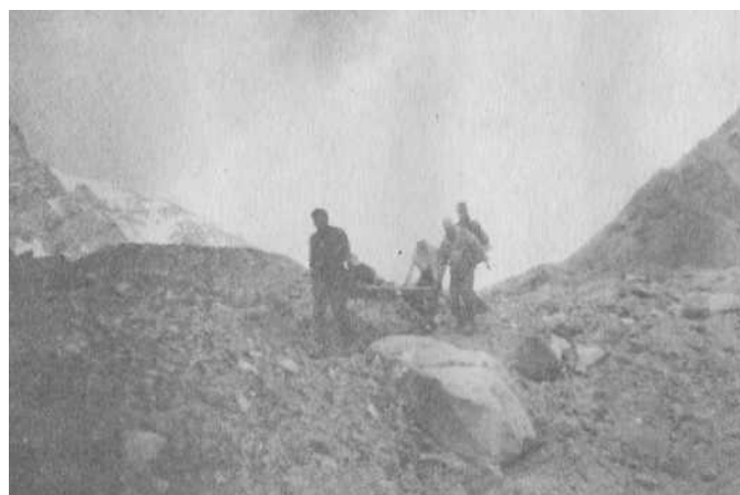
Хождение по осыпям. Поляна Москвина