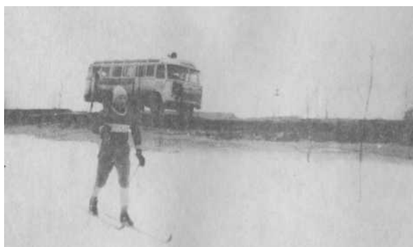
Ленинград - Москва. 137 километр